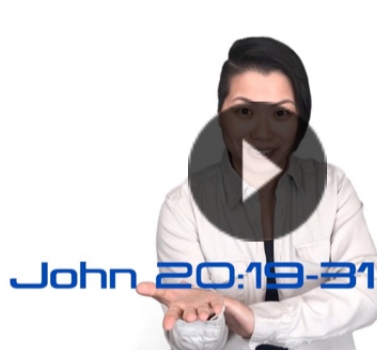
Word Up, TWEENS! 約翰福音二十（英語中字）